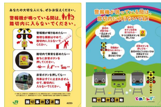
クリアファイルデザイン（イメージ）