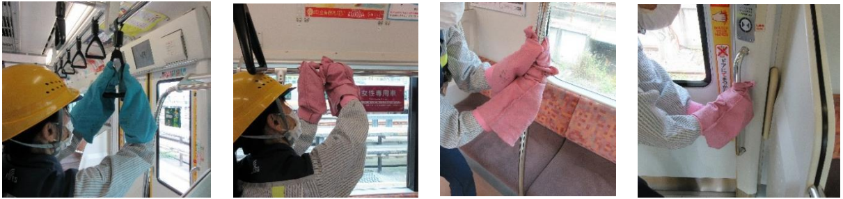
車両の清掃・消毒（E233系）