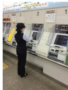
券売機の清掃・消毒（三鷹駅）