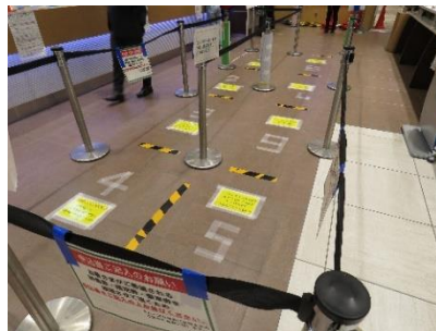
ソーシャルディスタンスの確保（左図：拝島駅、右図：立川駅みどりの窓口）