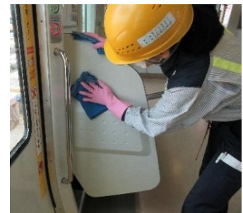
車両の清掃・消毒（E233系）