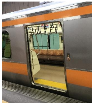
半自動ドアの自動開扉