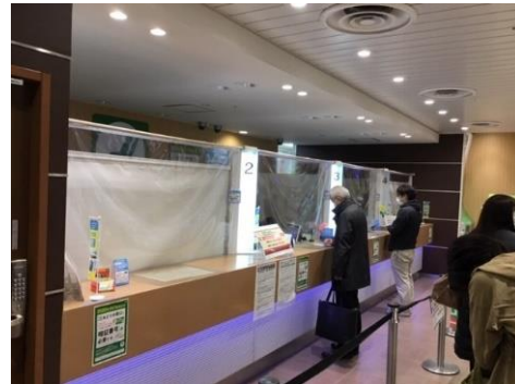
飛沫拡散防止用シート（左図：立川駅東改札、右図：立川駅みどりの窓口）