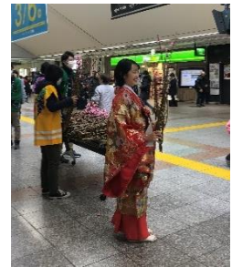
【湖衣姫 桃の花枝配布(イメージ)】