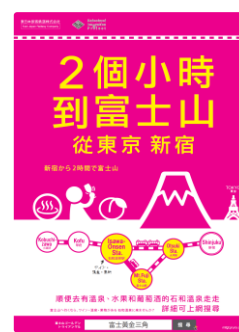
富士山ゴールデントライアングルPRポスター