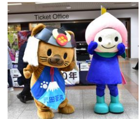
【「武田菱丸」と「モモずきん」(イメージ)】

パンフレットの配布や観光案内のほか、山梨県のご当地キャラクター「武田菱丸」・JR の山梨キャラクター「モモずきん」等キャラクターによる観光 PR