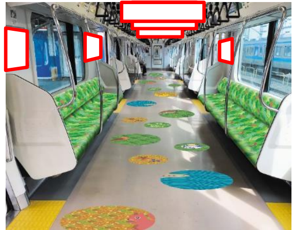
掲出箇所のイメージ