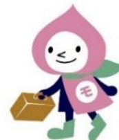
JRの山梨キャラクターモモずきん