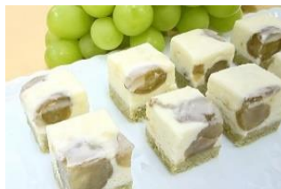
シャインマスカットレーズンショコラ