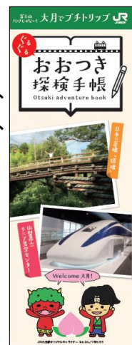
おおつき探検手帳

首都圏にあるJR東日本訪日旅行センター、山手線および八王子支社管内の主な駅で配布しています。