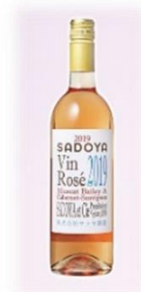
山梨ヌーボー「ヴァン ロゼ 2019」