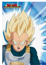
オリジナルクリアファイル ベジータバージョン