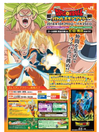
ポスターイメージ （デザインは変更になる場合があります）