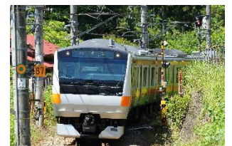
「快速 青梅 奥多摩号」 E233系（イメージ）