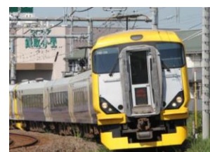
「外房初日の出号」(イメージ)

高尾・八王子・立川・国分寺・三鷹・新宿・秋葉原・錦糸町・船橋・ 津田沼・千葉・蘇我・茂原・大原・御宿・勝浦・安房小湊・安房鴨川・ 太海・和田浦・千倉