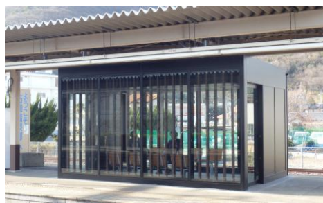
上りホーム待合室