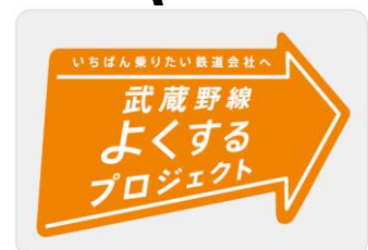
「武蔵野線よくするプロジェクトロゴマーク」