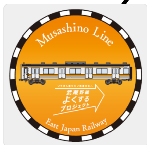
「武蔵野線よくするプロジェクトロゴマーク」