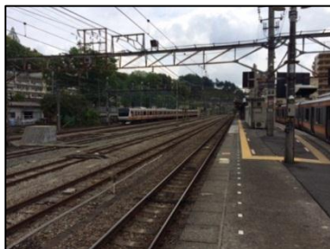
【現状①（奥多摩方面から見たホーム）】