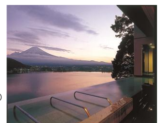
露天風呂（イメージ）