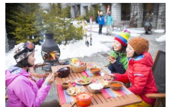
スノーリゾートタウン (イメージ)