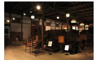
ワイン資料館（イメージ）