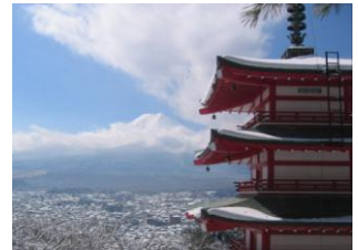
新倉山浅間公園（忠霊塔） （イメージ）