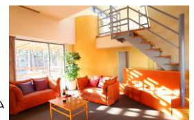
メゾネットルーム (イメージ)