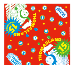
【トーマスランド15周年記念バンダナ】