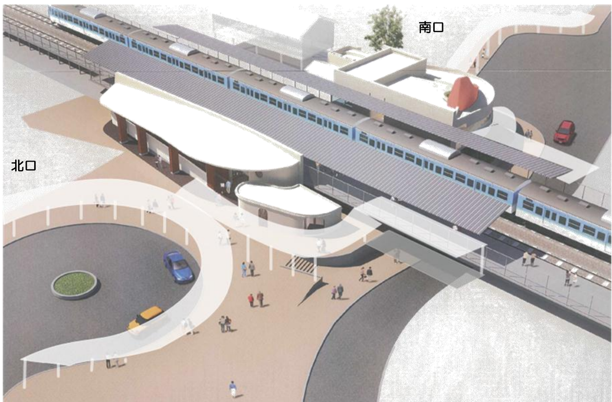
全体完成イメージパース