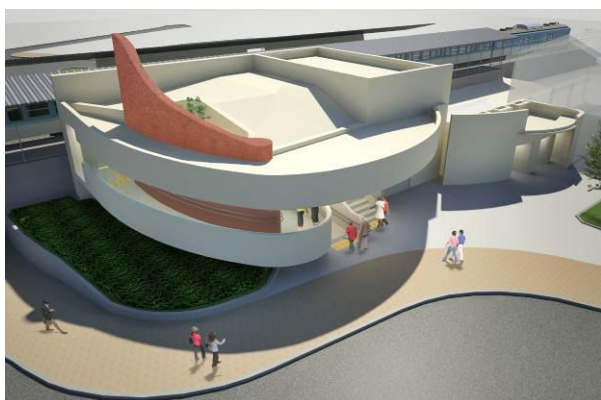
南口駅舎完成イメージパース