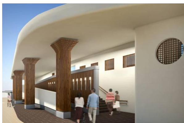
北口駅舎完成イメージパース