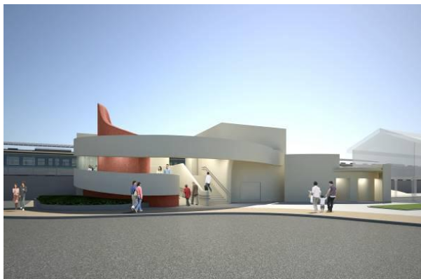
南口駅舎完成イメージパース