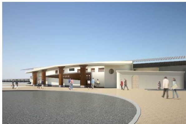
北口駅舎完成イメージパース