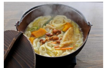
ほうとう(昼食のイメージ)