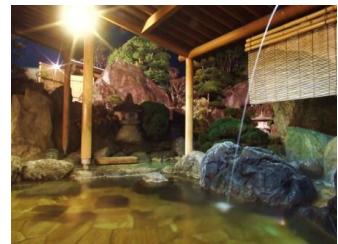
石和温泉の露天風呂(イメージ)