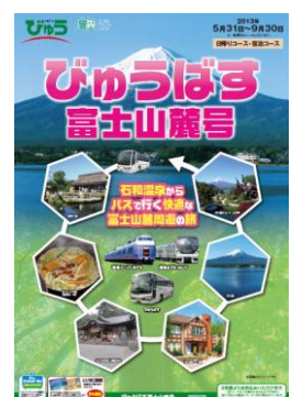
パンフレット(イメージ)

【取扱店舗】首都圏の主な駅にあるびゅうプラザの旅行カウンター・ びゅう予約センター等