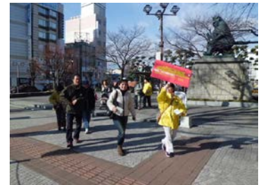
写真はイメージです （八王子駅コースではありません）