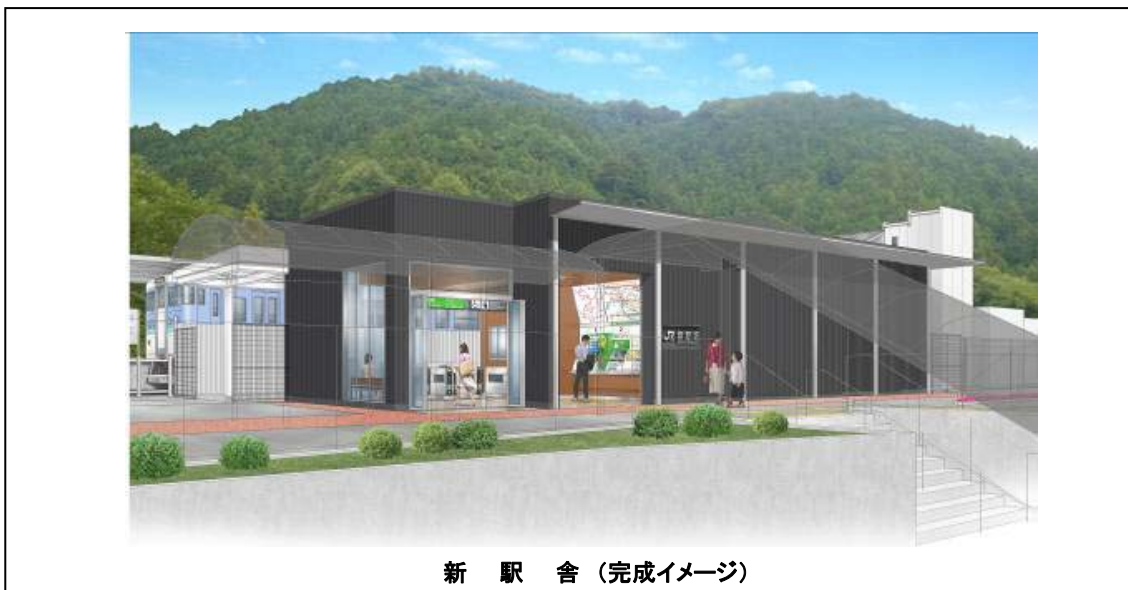
新 駅 舎 (完成イメージ)