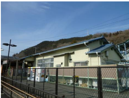
旧 駅 舎