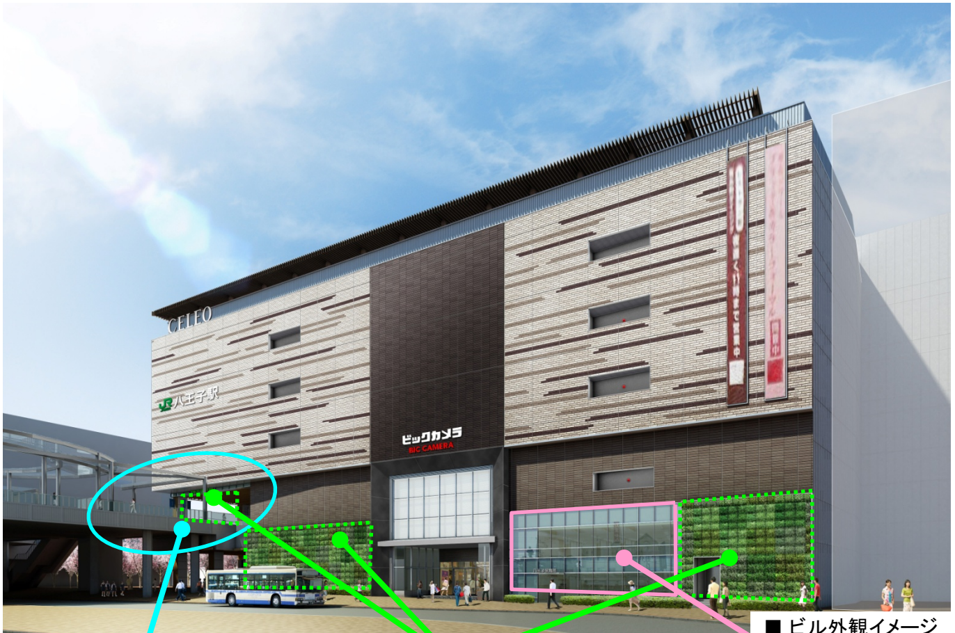
■ ビル外観イメージ

「ナチュラル」「八王子スタイル」「スタンダード」をキーワードに、八王子らしいライフシーンを提案します。