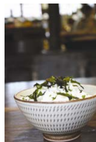
めのはめし(イメージ)

ドリンク 黒豆コーヒー、こおか茶、ほか モーニングセット めのはめしセット、トーストセットほか ランチセット カレーライスセット、ハヤシライスセットほか スイーツ だだっちゃ豆ロール、黒豆チーズケーキほか