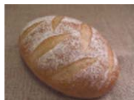
天然酵母パン 白神(イメージ)

無添加の天然酵母パンを地元企業より仕入れ、 群言堂オリジナルのこだわりの梅酵母を使用したパンを 地元八王子企業と共同開発し、販売します。