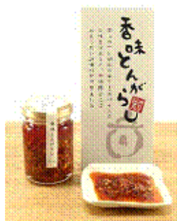
香味とんがらし(イメージ)