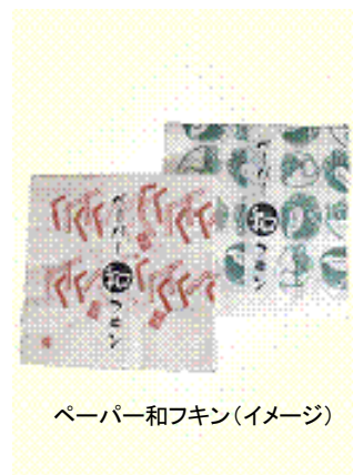
ペーパー和フキン(イメージ)