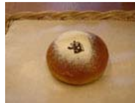
高尾天狗パン(イメージ)

もっちりとした食感の米粉パンを販売します。 米粉パンは、地元八王子の企業より仕入れを行い、 地元企業と共同開発した高尾天狗パンを販売します。