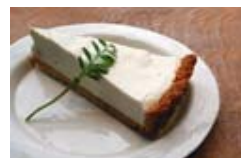
黒豆チーズケーキ(イメージ)