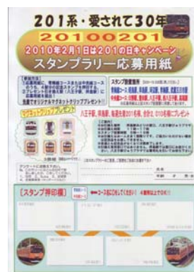
スタンプラリー応募用紙 (イメージ)

詳しくは、対象駅に掲出しますポスターや八王子支社ホームページまたは応募用紙をご覧ください。