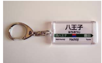
駅名キーホルダー(イメージ)

上記の他、今後もキャンペーンの一環として、記念旅行商品の発売やイベントを実施します。詳しくは、決まり次第お知らせします。