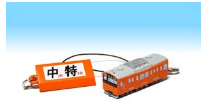
電車携帯ストラップ(イメージ)

《商品内容》電車携帯ストラップ、駅名キーホルダーなど ※3月1日以降にも中央線「201系」関連グッズを発売する予定です。