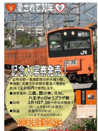
記念入場券発売案内ポスター (イメージ)

《発売箇所》三鷹駅 びゅうプラザ前 国分寺駅 びゅうプラザ前 立川駅 びゅうプラザ前 八王子駅 びゅうプラザ前