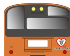
記念ヘッドシール(イメージ)