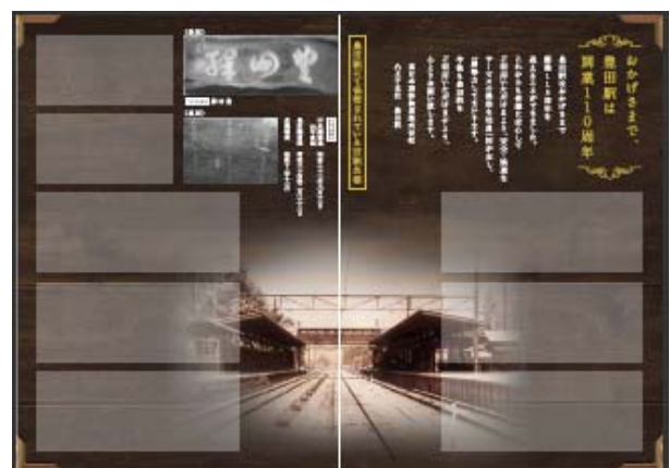
記念入場券台紙（イメージ）