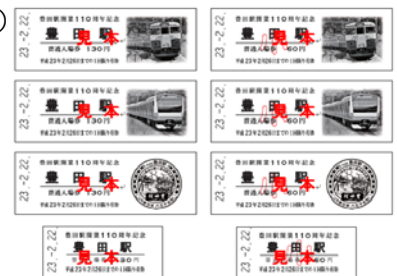
記念入場券（イメージ）