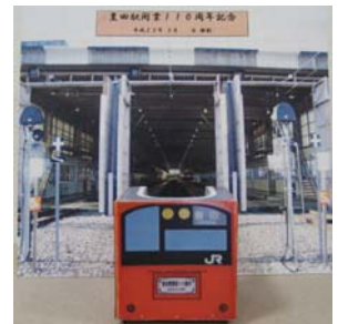
201系特製撮影台(イメージ)