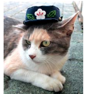
青梅鉄道公園猫園長「のら」

「のら」のプロフィール 2010年9月23日より青梅鉄道公園猫園長 性別：メス、年齢：不詳