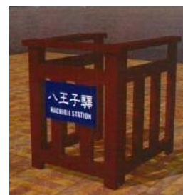
デモンストレーションでの改札(イメージ)

《参加方法》 ・ラリー用リーフレットに「入錠痕」を5駅以上集めて、上記のイベント会場にお越しいただくと、もれなく記念のレプリカ乗車券等をプレゼントします。また、レプリカ乗車券には改札錠で入錠をしてもらえます。 ・なお、当日上記会場にて当該駅ビル(江戸東京たてもの園の場合は園内の売店等)の2,000円以上ご購入レシート(合算は不可)を提示していただいた方も同様に「改札錠デモンストレーション」に参加することができます。