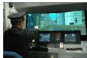
運転シミュレーター(イメージ)