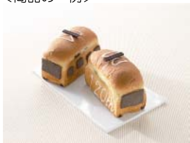
記念電車パン 1個 368円(ドンク) <八王子ナウ内 そごう八王子店>