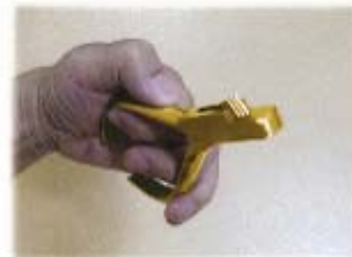
金色の改札鋏(イメージ)

《概要》 かつて、駅では改札から入場する際、駅員が切符にハサミを入れていました。今回のイベントでは、最近は見かけなくなった「改札鋏」を使用して、ラリー参加者ご自身がリーフレットにハサミを入れて各駅をまわる「体験型」のラリーを実施します。