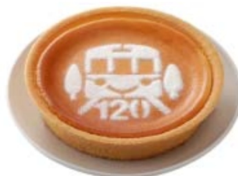
記念チーズケーキ 1,050円(モロゾフ) <八王子ナウ内 そごう八王子店> <国分寺エル内 国分寺マルイ >