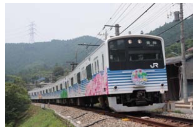
「四季彩号」(現在のラッピング) 座席定員:201名(4両編成)

また、奥多摩寄りの4号車車内は多摩川の渓谷を楽しめるようにすべての座席を川側に向け、1～3号車車内は川側にボックスシートを設置、窓も川側が2枚窓から1枚の大型窓に変更して、青梅線沿線の自然を車窓から楽しんでいただけるようにしました。