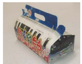
「さよなら四季彩号」特製弁当 (イメージ)