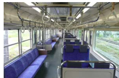
「四季彩号」1～3号車車内