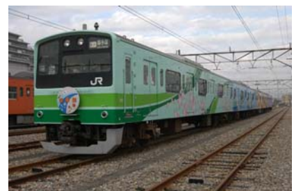
「四季彩号」 (2001～2005年ラッピング)