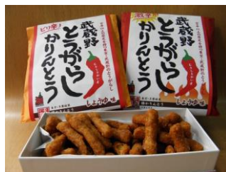
武蔵境名物とうがらしかりんとう