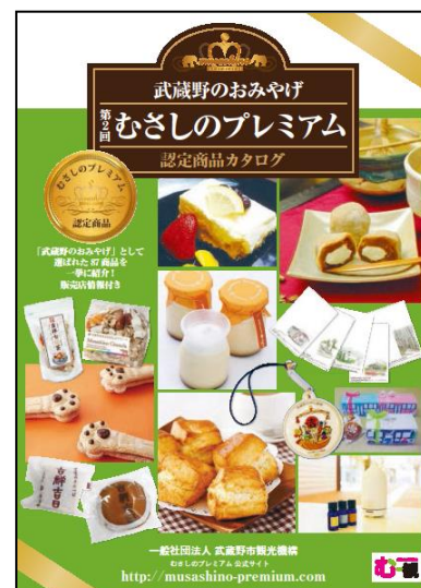
「むさしのプレミアム」カタログ

また、「タリーズコーヒー」の店内でも、「むさしのプレミアム」の商品をディスプレイして紹介していきます。