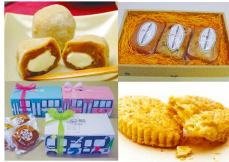
むさしのプレミアム商品