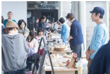
マーケットイメージ

nonowa 武蔵境 EASTの南側には、約200㎡の屋外イベント広場「nonowa Terrace」を整備し、各種イベントを開催していきます。開業記念の第1弾としては、6月10日(金)～12日(日)の3日間で、多摩・武蔵野エリアの魅力ある商品を紹介・販売する「nonowa マーケット」を開催します。今回は、「むさしのプレミアム」の商品とも連携して、多摩・武蔵野エリアの魅力を発信します。今後も、キッチンカーの出店や地域と連携したイベントなど、地元を盛り上げる賑わいづくりを計画していきます。