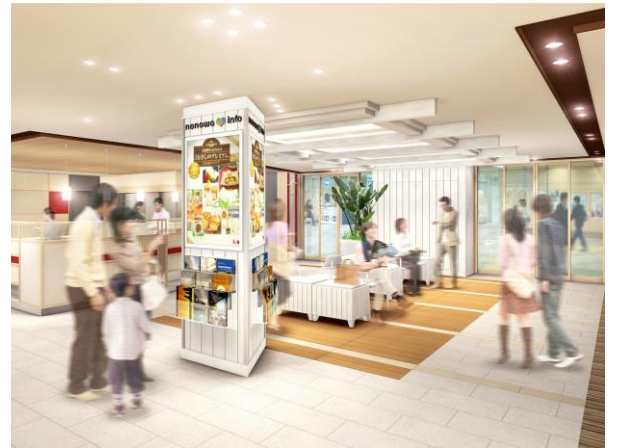
イベント・レストスペース、nonowa info 周辺