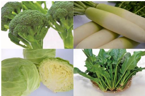
多摩・武蔵野エリア産の野菜

八王子市に本社を置き、百貨店を中心に展開している青果店です。季節を彩る旬の果物・野菜を取り揃え、地元の多摩・武蔵野野菜も取り扱います。また、今回、武蔵野市内で初となる「むさしのプレミアム」商品の常設販売コーナーを設置し、「むさしのプレミアム」商品を季節ごとにセレクトして展開していきます。