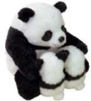
上野案内所 ハグハグ親子パンダ

チェックポイントで 私たちが待ってるよ♪ 周遊しながら上野の おすすめスポット も見つけてね！