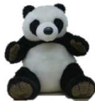
アトレ上野 アトパン