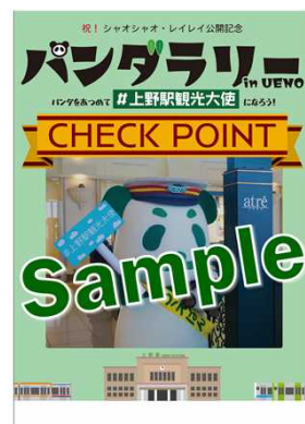
チェックポイント ポスター見本

チェックポイントで 私たちが待ってるよ♪ 周遊しながら上野の おすすめスポット も見つけてね！