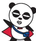
京成電鉄 京成パンダ