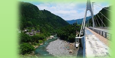
奥多摩大橋から眺めた川井キャンプ場