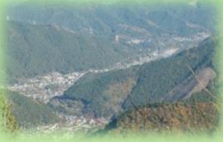
御岳山からの景色