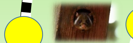
御岳山に住むムササビ