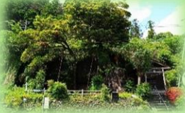
古里附のイヌグス