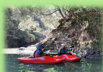
白丸湖のカヤック