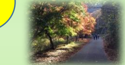
奥多摩～奥多摩湖 むかし道