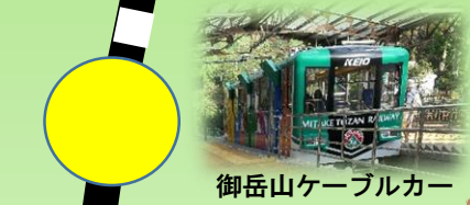
御岳山ケーブルカー