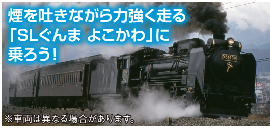
※車両は異なる場合があります。