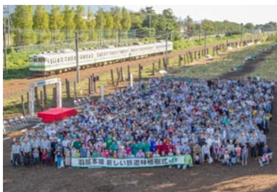
羽越本線平木田3号林植樹式(2014年9月20日)

ご自分の手で植えた苗木がやがて大きく育ち、生きた鉄道防災設備として役立つことを実感されていました。