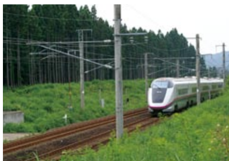
奥羽本線 神宮寺2号林(ふいぎ防止林)

2008年からは、線路の防災と沿線の環境保全の両立をめざして鉄道林のあり方を根本的に見直し、更新時期を迎えた樹木を約20年かけて植え替える「新しい鉄道林」プロジェクトをスタートしました。