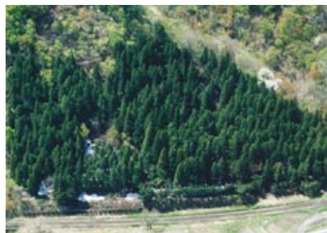
米坂線 手ノ子6号林(なだれ防止林)