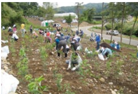
2014年9月に開催した「信濃川ふるさとの森づくり」

JR東日本では、自然への感謝の気持ちを持つとともに、生物多様性を守り持続可能な社会へ貢献するため、その土地固有の樹木を植えて森を再生する活動「ふるさとの森づくり」を2004年から始めています。2004年から2009年は福島県で、2010年から2014年は新潟県、同県津南町、同県十日町市および同県小千谷市の協力を得て、この「ふるさとの森づくり」を開催しています。このほかにも、JR東日本の各エリアにおいては、地域に根ざした植樹を実施しており、今後も継続的に取り組んでいきます。