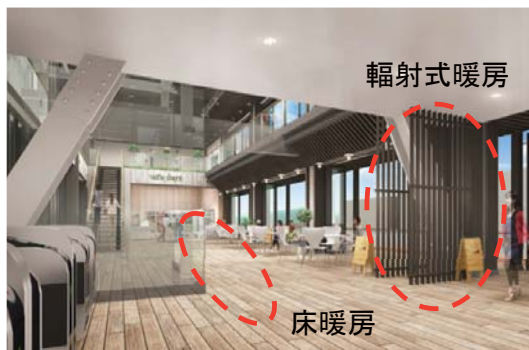
床暖房・ ふくしや 輻射式暖房 (イメージ)

観光資源である温泉と豊かな自然に囲まれた湯本駅を「エコステ」モデル駅に位置付け、太陽光・福島県産木材・温泉熱等の地域資源を積極的に活用しています。