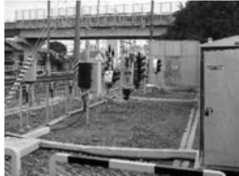
図3 専用エリアにおける試験用信号機器の試験

る。さらに信号機器以外にも、光ケーブル分岐用の接続箱(光成端箱)や電源用の器具箱を設置している。