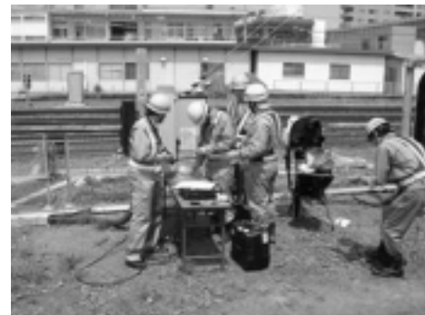
図8 光ケーブルに関する施工性確認の様子

ブルの取り扱いや接続は、ネットワーク信号制御システムの重要な項目となる。そこで、屋外環境での光ケーブルおよび光成端箱の施工性確認を行なった。その際、5種類の光ケーブル、3種類の光成端箱について施工を行ない、比較検討を行なった。また、光ファイバ芯線接続工法についても3種類(融着接続、メカニカルスプライシング接続、コネクタ直接接続)の施工を行なった。これらの作業の様子を図8に示す。