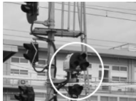
図5 上り入換信号機柱に設置した試験用入換信号機

色灯信号機として、下り本線出発信号機と同一の信号機柱に試験用信号機(3現示)を設置した(図4)。同様に、入換信号機として、上り入換信号機とほぼ同一箇所に設置した(図5)。また、試験用ATS-S形地上子を下り本線上に設置している。