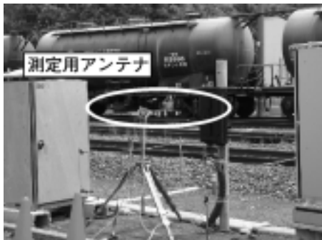
図7 電磁界ノイズ測定の様子