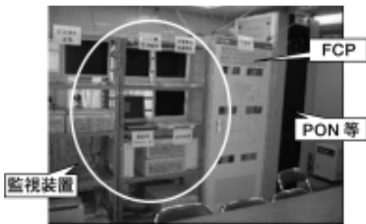
図2 仮信号機器室の中の様子

仮信号機器室の中の様子を図2に示す。ネットワーク機器室論理部(FCP)、光伝送装置(PON)、各種監視装置が設置されている。