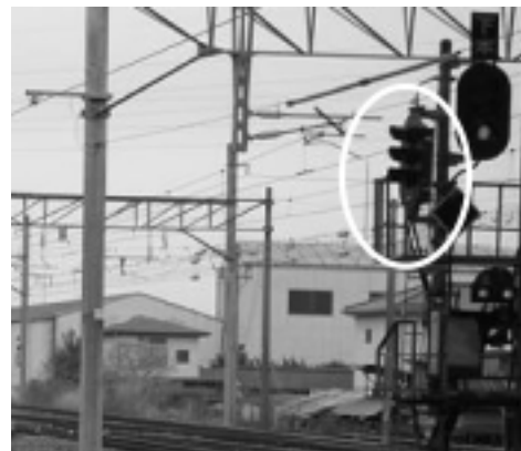
図4 下り本線出発信号機柱に設置した試験用色灯信号機

信号機器の現場検証の場所として、専用エリアとは別に、本線上に試験用信号機器を設置した。これは、試験用の信号機器の環境条件(列車による振動や、現地温度、電磁ノイズなど)が実際の環境と同じになることを意図している。