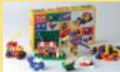
賞品:ダイヤブロックバラエティ300