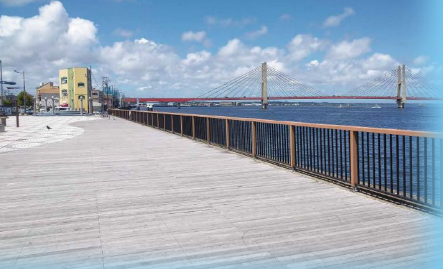
川岸公園からの「銚子大橋」