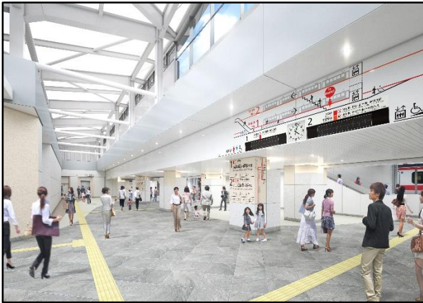
【改札内コンコースイメージ図】