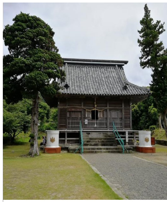
【布良崎神社・本殿】