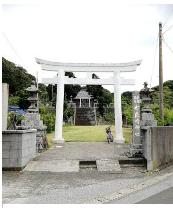
【布良崎神社・鳥居】