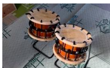
【間之町祭礼用締太鼓】