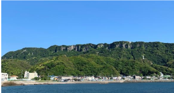
【東京湾から臨む鋸山】