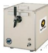
ビールサーバー （イメージ）