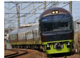
リゾートやまどり外観（イメージ）