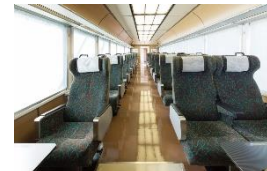
リゾートやまどり車内（イメージ） （お手洗い休憩）