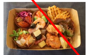
特製おつまみセット（イメージ）