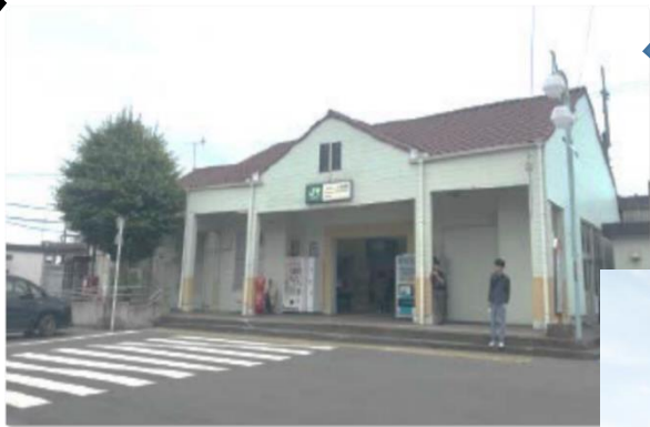
駅前広場から望む既存駅舎