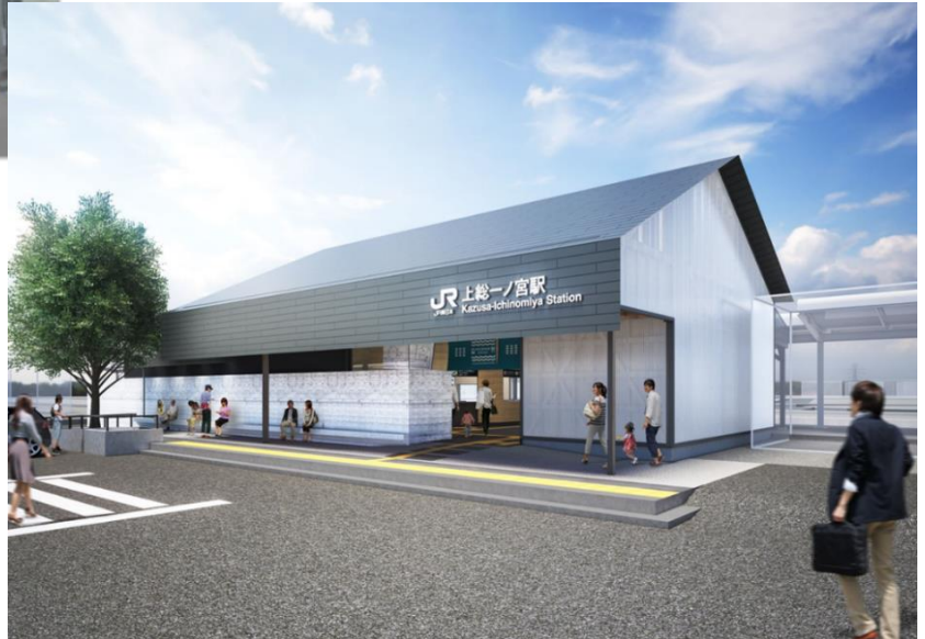
駅前広場から望む駅舎イメージ