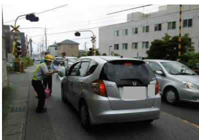
【踏切でのキャンペーン中の様子】

駅前広場、交通量の多い踏切等で関係警察署等と協力し、「踏切通行時」の取扱いを示したリーフレットの入ったキャンペーングッズを配布し、踏切を通行するドライバーや歩行者などに踏切事故防止を働きかけます。