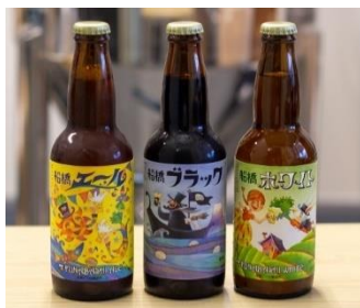
【船橋ビール醸造所】

今回は9店舗中7店舗が初出店！人気の道の駅の出張販売や、秋を感じる旬の野菜・果物・お米、千産千消にこだわった手作りプリンや季節限定のスイーツ、船橋ならではの味を追求したクラフトビールなど様々な魅力ある商品を取り揃えておりますので、この機会にぜひお立ち寄りください！