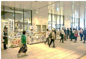
【画像は過去に開催したちばのいちの様子】