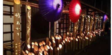
「さわら・町並み・竹灯り」(イメージ)

「さわら・町並み・竹灯り」は、佐原の風情ある町並みを夕暮れに楽しんでいただきたいと企画されたイベントです。8/10～15の期間中は商家や小野川沿いが竹灯りや和傘で彩られます、なかでも14日は、灯ろう流しやナイヤガラ花火などが開催されます。ぜひ風情ある佐原の町並みをお楽しみください。