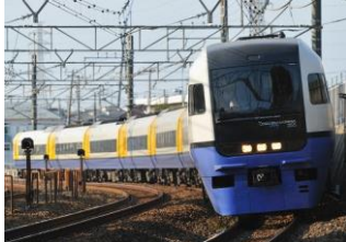
255系特急車両(イメージ)

停車駅: 大宮 南浦和 南越谷 南流山 新松戸 新八柱 東松戸 西船橋 海浜幕張 蘇我 御宿 勝浦 鶴原 上総興津 安房小湊 安房天津 安房鴨川