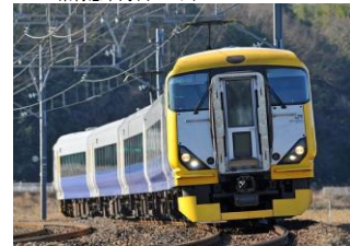
E257系特急車両(イメージ)

■佐原で開催される「佐原の大祭 夏祭り」に、新宿から直通する便利な特急列車を運転します。