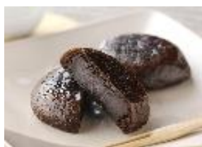
【(株)菜花の里（黒平まんじゅう本舗）】