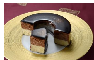
【信栄開発(株)（せんねんの木）】