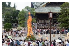
さいとうおおごまく 柴灯大護摩供(イメージ)