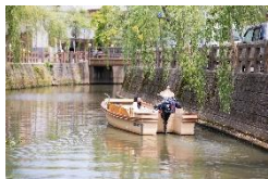
さっぱ舟(イメージ)