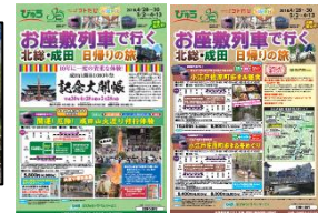
パンフレット(イメージ)