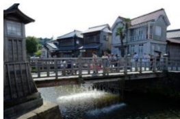
佐原の町並み(イメージ)