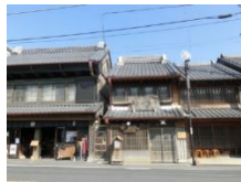
佐原の町並み(イメージ)