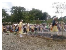
火渡り修行体験(イメージ)