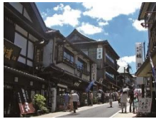
成田山参道(イメージ)