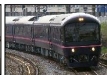
お座敷列車 「華」(イメージ)