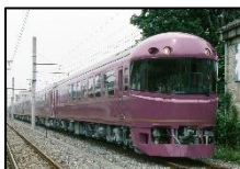
お座敷列車 「宴」(イメージ)

2018年4月28日(土)～5月28日(月)に開催される成田山開基1080年祭記念大開帳に合わせて、成田山へのおでかけや、小江戸佐原を楽しむ旅、成田ゆめ牧場で生マシュマロ作り体験など幅広い世代の方にお楽しみいただける全5コースをご用意いたしました。