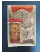
和菓子詰め合わせ(イメージ)