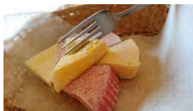
生マシュマロ(イメージ)