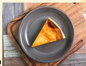
バイクドチーズケーキ

タニタカフェのスイーツを葛西臨海公園駅高架下施設「Ff(エフエフ)」にて販売します！タニタコーヒーやバイクドチーズケーキ、ガトーショコラといった、タニタカフェで人気のメニューをお楽しみいただけます。