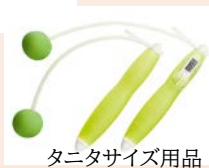
タニタサイズ用品