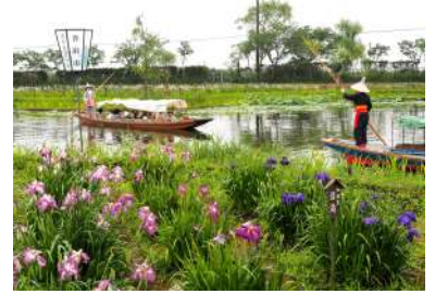
水郷佐原あやめパーク 舟乗船券&佐原名産の朝採りイチヂクをプレゼント