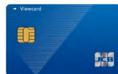
ビューカード スタンダード