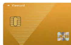
ビューカード ゴールド