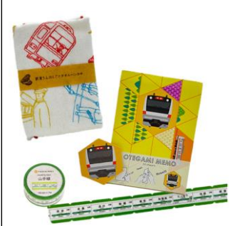
賞品③ 鉄道ステーションナリーセット