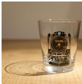
賞品② オリジナルグラス D51