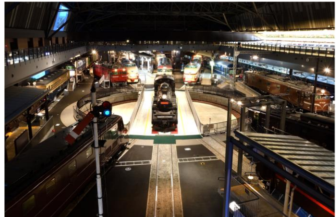
賞品④ 鉄道博物館入館チケット(一般)4名様分