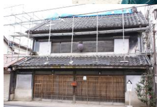
磯田家見世蔵 (茨城県)