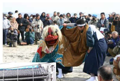
請戸獅子舞 (福島県)

【HP】 http://www.national-trust.or.jp/shinsaishien.html