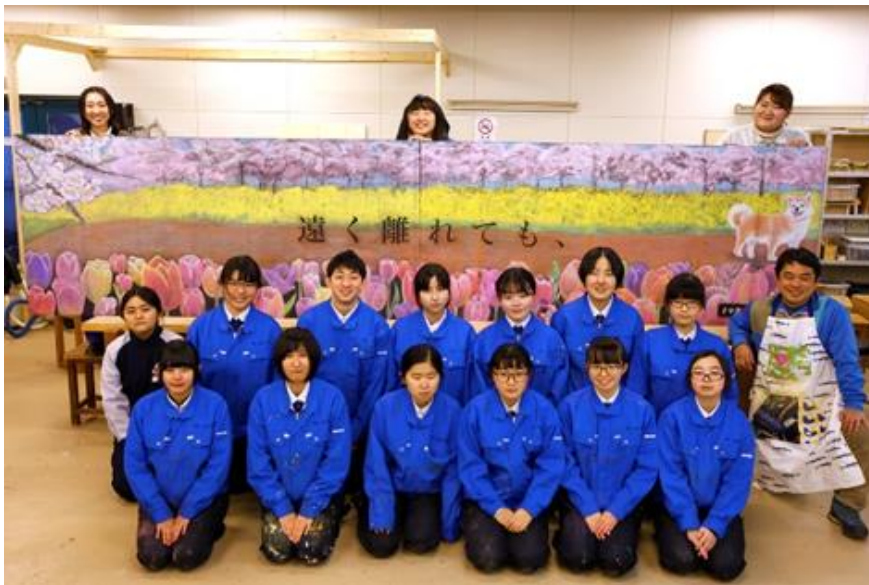
※秋田駅に設置する黒板アートのイメージです