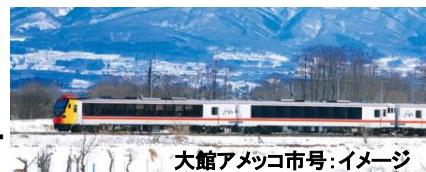
大館アメッコ市号:イメージ