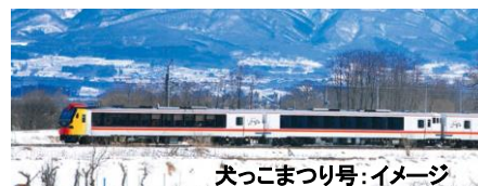
犬っこまつり号:イメージ