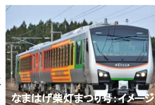
なまはげ柴灯まつり号:イメージ