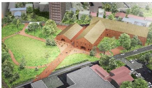
弘前れんが倉庫美術館イメージ