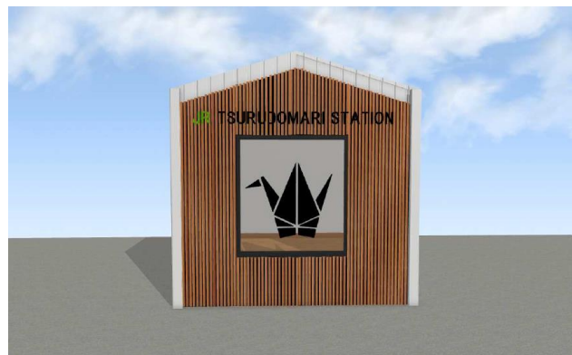
【新駅舎 完成イメージ】