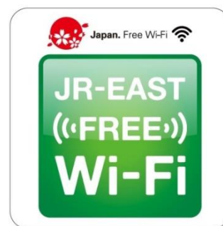
「JR-EAST FREE Wi-Fi」 ステッカー（イメージ）

サービスのご利用が可能な車両には、車内に「JR-EAST FREE Wi-Fi」ステッカーを掲示しております。